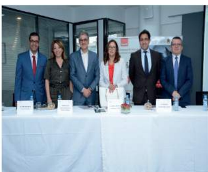
Comité AITEX APEBI