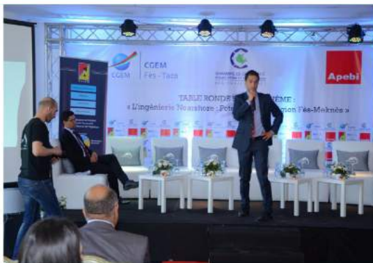
TABLE RONDE SUR L'INGENIERIE NEARSHORE

Le 12 mai dernier l'APEBI a pris part à une table ronde organisée par la commission offshoring de la CGEM, sur le thème de l'ingénierie Nearshore. L'objectif était de permettre aux différents acteurs du secteurs de pouvoir se recontrer afin de partager leur expérience.