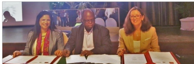
Signature de l'Accord de coopération entre l'Apebi, Maroc Export et le Club des DSI de Côte d'Ivoire

Au mois de juin 2016, dans la volonté de renforcer les liens de coopération économique et commerciale entre le Maroc et la Côte d'Ivoire, l'Apebi a signé deux conventions avec des organisations ivoiriennes : un Protocole d'accord de coopération entre l'Apebi, Maroc Export, le groupe Banque Centrale Populaire et la commune de Cocody et un Accord de coopération entre l'Apebi, Maroc Export et le Club des DSI de Côte d'Ivoire.